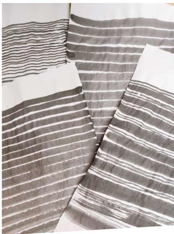
Verschiedene schöne Zeichenübungen beim Kurs

Pinsel, Reibstein, Tintenblock und hochwertige Papiere: Bereits das Betrachten des Werkzeugs machte Lust, tiefer in diese meditative Art des Malens einzutauchen. Der Künstler Luis Seiwald erklärte zum Einstieg, welcher Zweck bei der Tuschemalerei verfolgt wird, nämlich achtsam zu sein, sich auf das Wesentliche zu konzentrieren und die Eleganz der Einfachheit zu spüren. Die begeisterten Teilnehmer:innen kamen nach vorbereitenden Übungen bald schon in einen Zustand, in dem das Ich und die Malerei im Einklang standen. Sie entdeckten dabei, dass Tintenspurten auf dem Papier Eigenheiten besaßen, dass mit unterschiedlicher Druckausübung die Stärke der Linienführung variiert, dass es eine unsagbare Vielzahl an Graustufen gibt. Aber auch, dass die Malerei etwas mit einem selbst macht, wenn die Atmung still wird und sich die Körperhal-