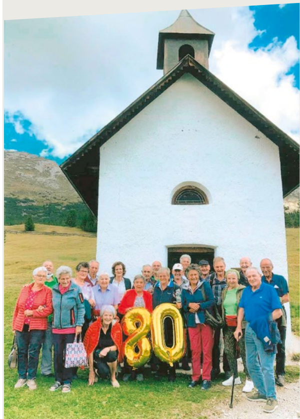
Die Teilnehmerinnen und Teilnehmer des Jahrgangstreffens von 1942 von Olang.

Zum guten Gelingen sie an dieser Stelle allen ein herzliches Dankeschön ausgesprochen. Alle 22 Teilnehmerinnen und Teilnehmer haben den schönen Tag richtig genossen.