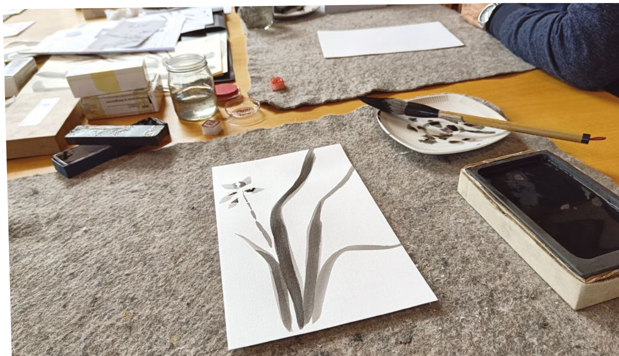
Das benutzte Werkzeug bei der Tuschmalerei