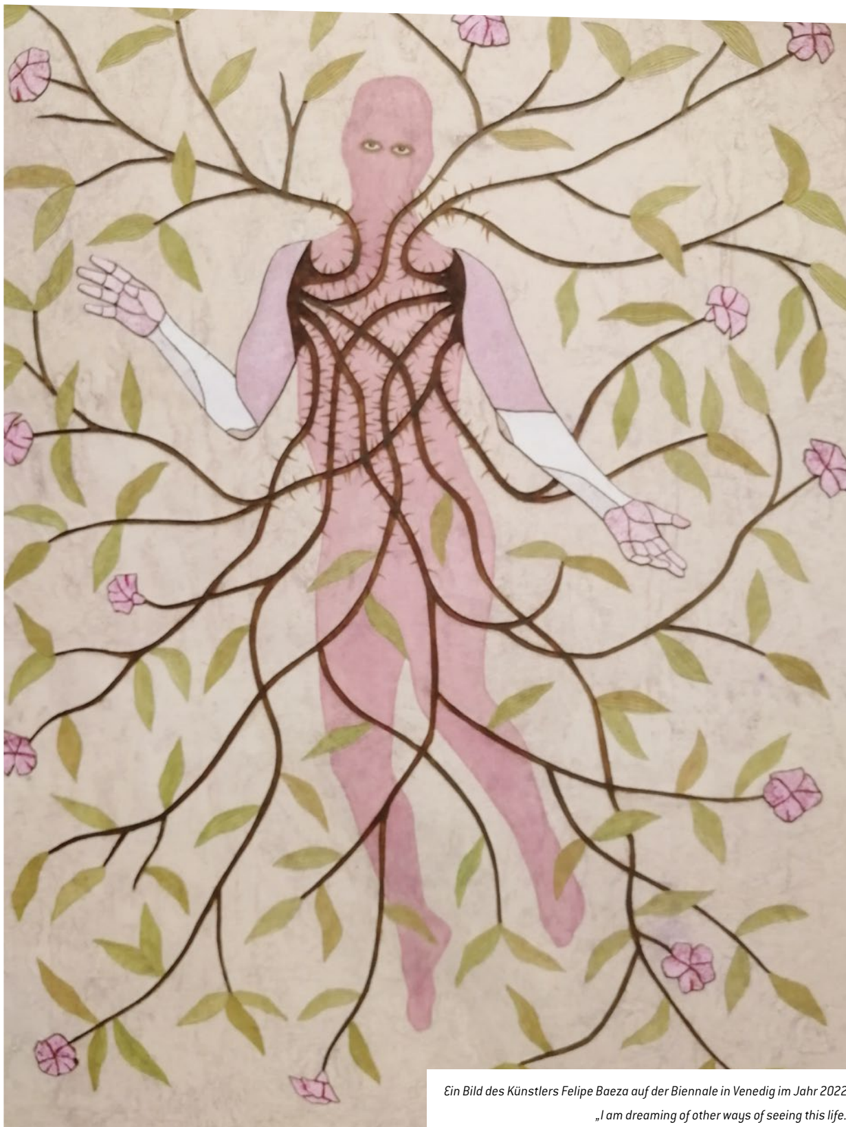
Ein Bild des Künstlers Felipe Baeza auf der Biennale in Venedig im Jahr 2022:

„I am dreaming of other ways of seeing this life.“