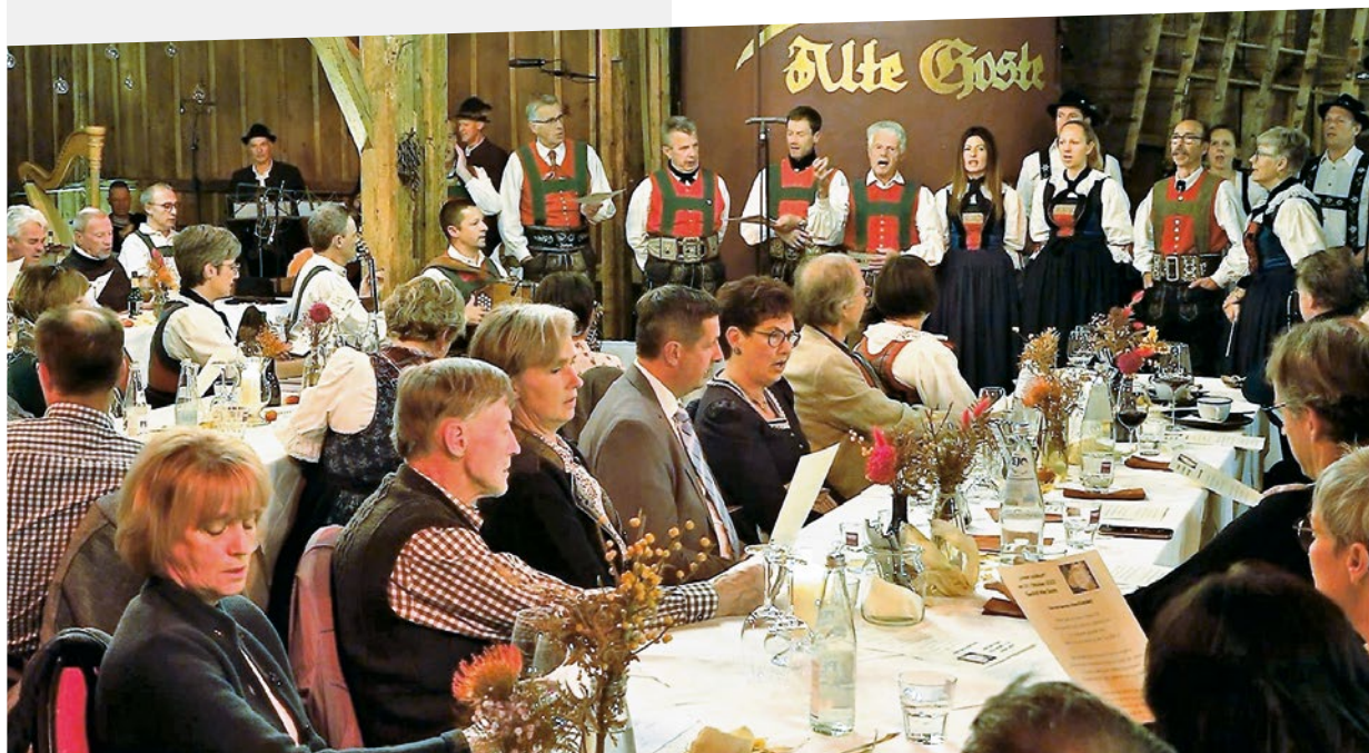
Beim Abschlusslied sangen alle gerne mit.