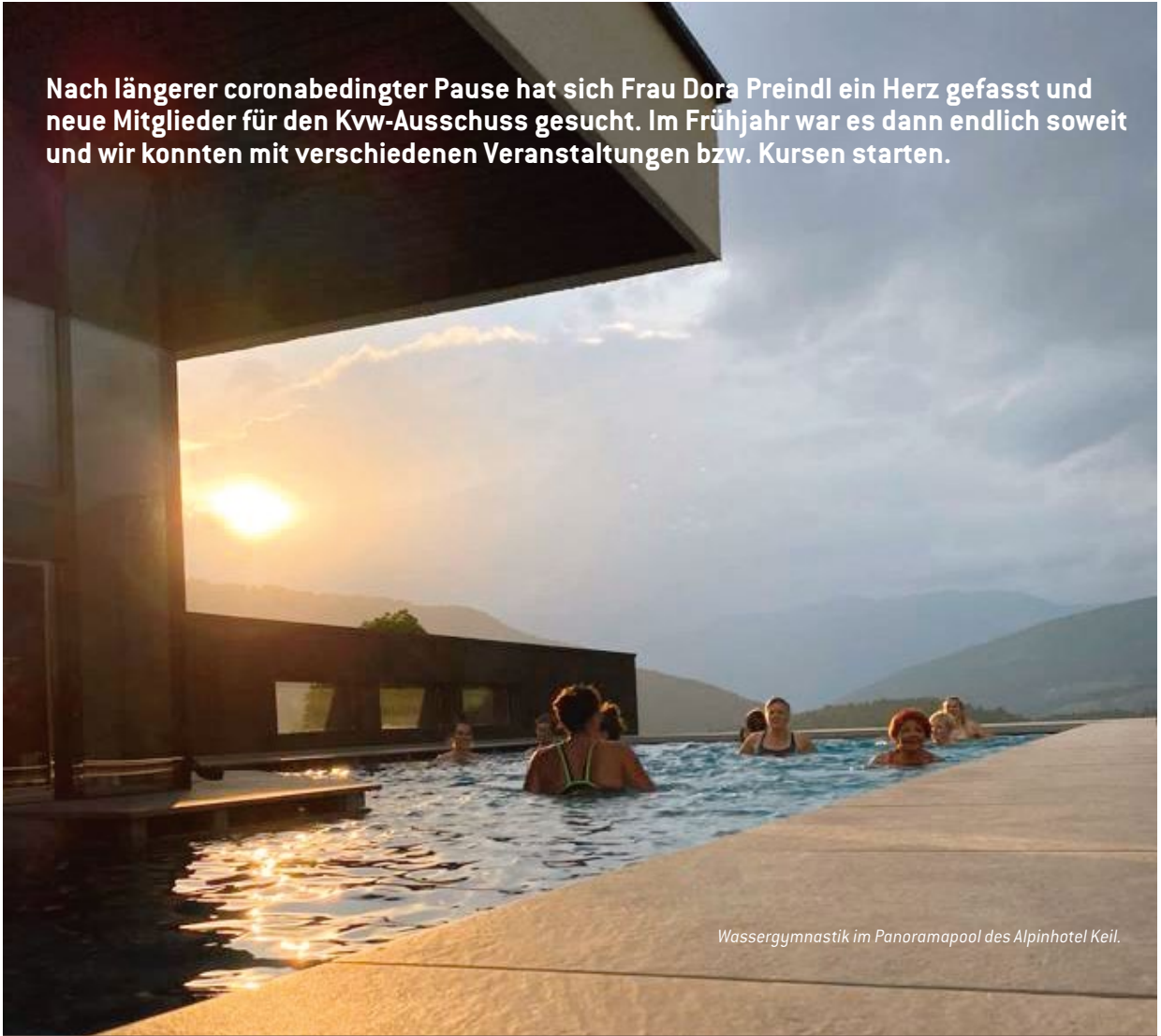
Wassergymnastik im Panoramapool des Alpinhotel Keil.