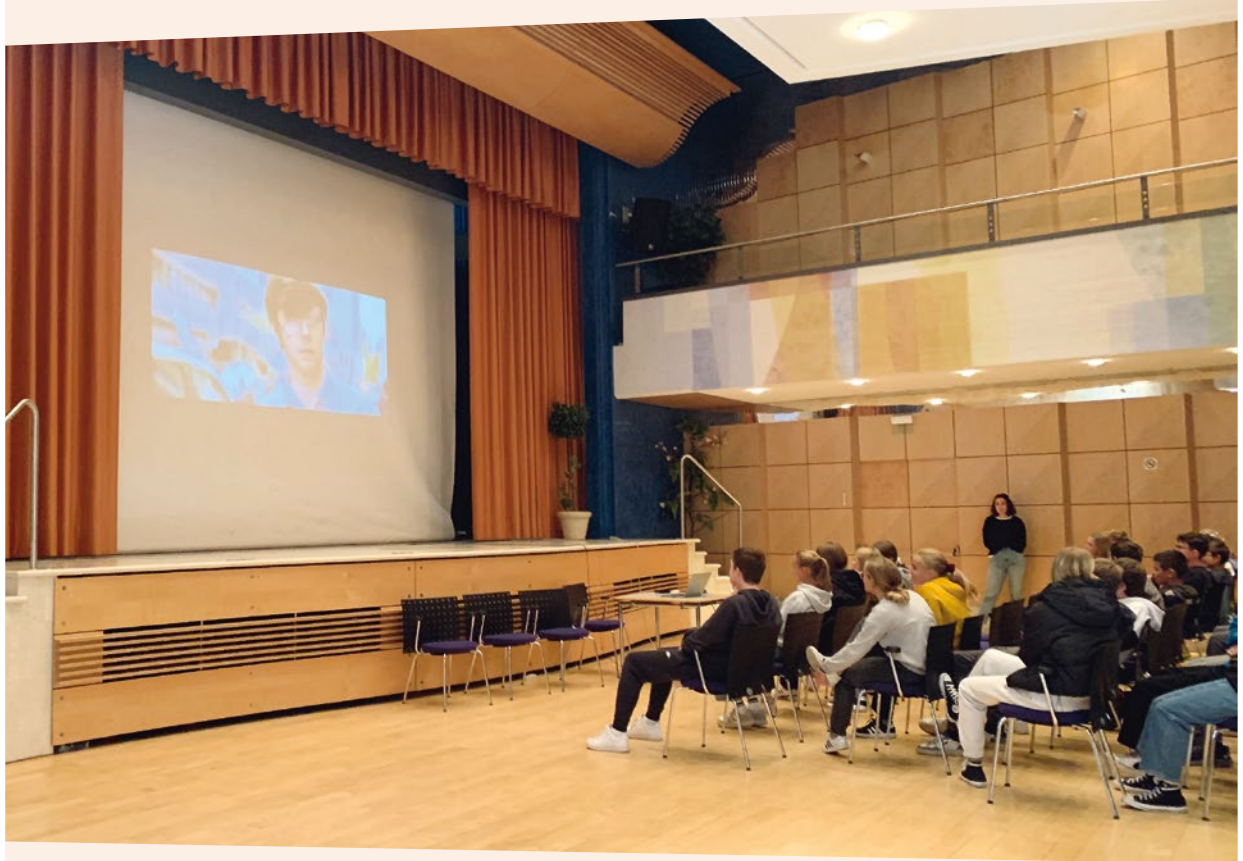
Mittelschülerinnen und Mittelschüler beim Vortrag von den Junghandwerkern im Ivh und der Hoteliers- und Gastwirtejugend in Olang.

Die Hoteliers- und Gastwirtejugend besuchte kürzlich die Mittelschule Olang und informierte die Schülerinnen und Schüler über die verschiedenen Ausbildungswege im Hotel- und Gastgewerbe sowie im Handwerk.