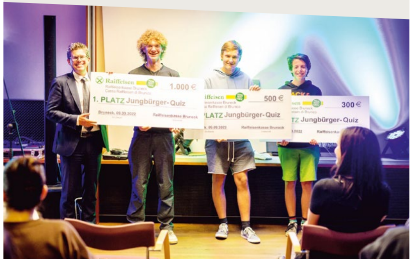
Die drei Prämieren beim Quiz.

Am Abend warteten zudem ein Einblick in den Kulturbonus des Staates sowie die Auflösung vom Jungbürger-Quiz, das die Jugendlichen im Vorfeld online ausfüllen konnten. Die Fragen beim Quiz drehten sich um die bürgerlichen Rechte und Pflichten, die Kennzahlen der Gemeinden sowie um die finanzielle Bildung. Abgerundet wurde das vom Jugenddienst und der Raiffeisenkasse Bruneck ausgearbeitete Quiz mit der Frage nach dem persönlichen Traum. Die Träume reichten dabei von einer Reise um die Welt, über das Erlangen der Selbstständigkeit, einem Studium und spannenden Berufen bis hin zu Träumen einer lebenswerten und sicheren Umwelt und Zukunft, dem Frieden und der Gerechtigkeit.