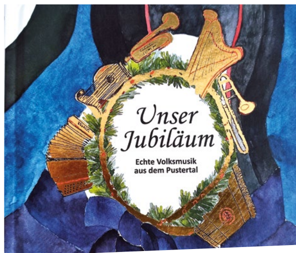
Die Jubiläums-CD kann erworben werden.