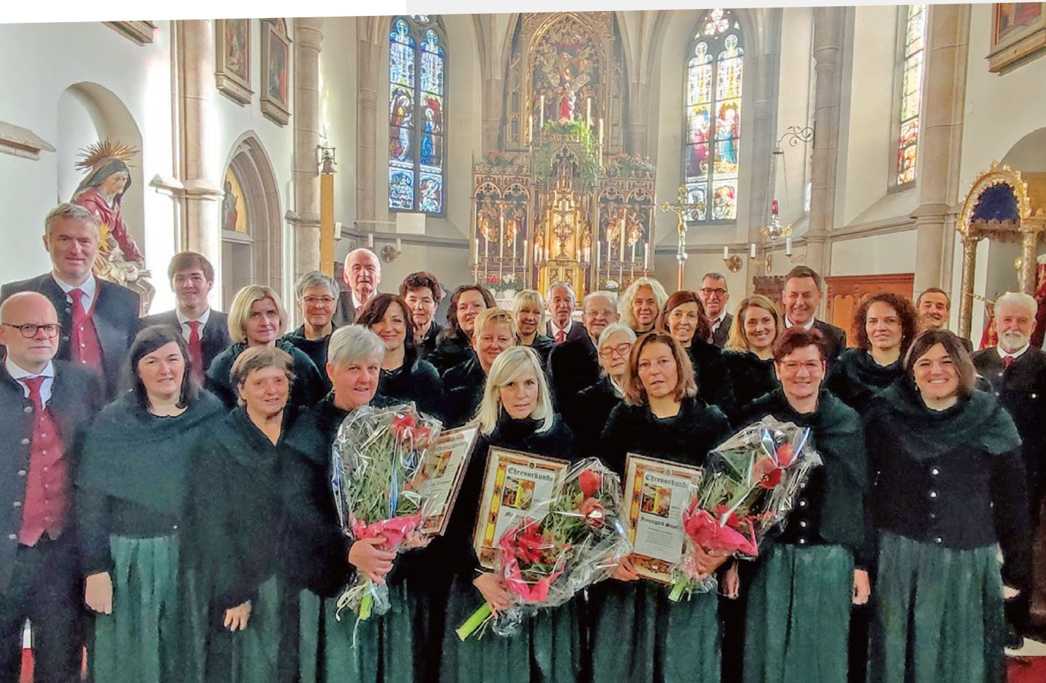
Der Kirchenchor von Oberolang mit den verschiedenen Geehrten.

Nach zwei durch die Coronapandemie sehr schwierigen und herausfordernden Tätigkeitsjahren hatte der Kirchenchor Oberolang am Cäcilien Sonntag 2022 wieder allen Grund zum Feiern. Endlich konnte der Chor wieder ohne Einschränkungen und in Vollbesetzung das Fest der Hl. Cäcilia – Patronin der Kirchenmusik – begehen.