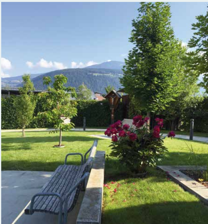
Der Park hinter dem Altenheim lädt zum Verweilen und Genießen ein.