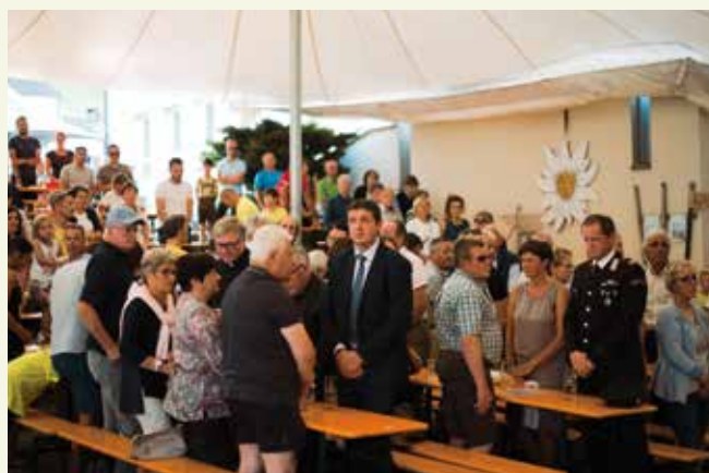
Zahlreiche Olinger kamen zur 60-Jahr-Feier des AVS.