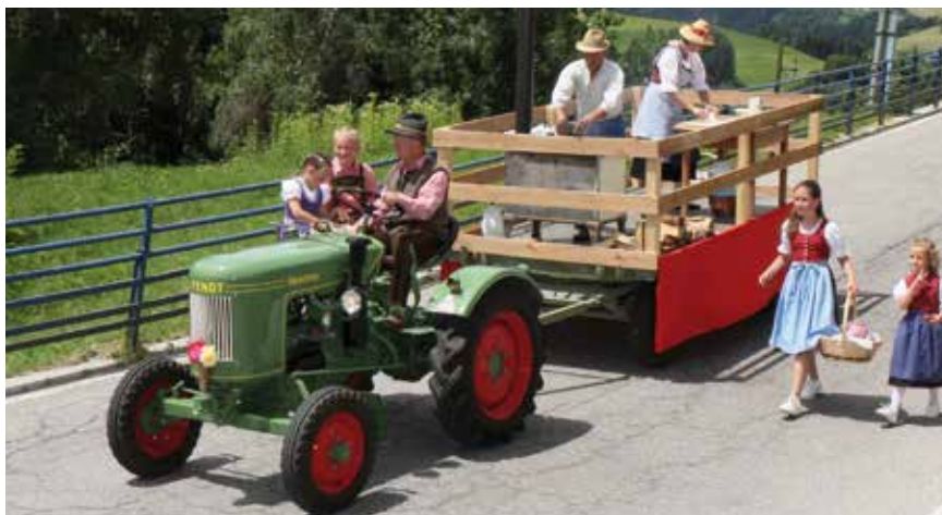
Der Umzug beim Pfarrlinga Kirscha lockte zahlreiche Besucher an.

Am Sonntag folgte die Festmesse mit anschließender Prozession, nach den letzten Takten der Pfarrmusik ging es musikalisch fließend mit dem Frühschoppen der Riffiner Pehmischen weiter. Am Nachmittag zog der alljährliche Festumzug mit Reitern, Pferden, Traktoren, Festwägen und Musikkapellen Besucher aus nah und fern nach Niederolang. Es folgten die Kon-