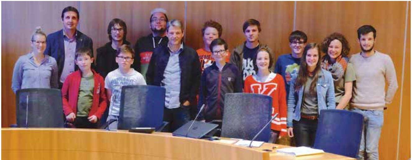
Der neugewählte Jugendbeirat.