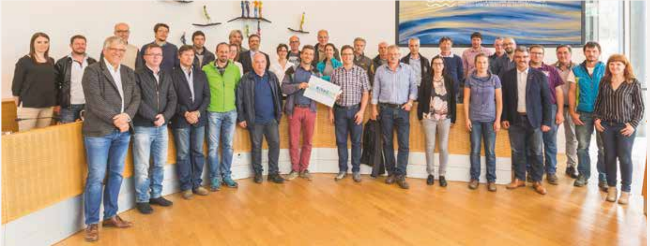
Zahlreiche Vertreter von Gemeinden, Institutionen, Verbänden und Interessensgruppen hatten sich zur Auftaktveranstaltung des Projektes „RIENZact“ eingefunden.

Vor Kurzem fand in Bruneck die Auftaktveranstaltung zu „RIENZact – Dialog zur Flussraumgestaltung“ statt. Bei diesem Projekt geht es um die Erarbeitung eines Flussraummanagementplans für die Rienz – ähnlich der bereits vorangegangenen Projekte „Obere Ahr“ im hinteren Ahrntal, „StadtLandFluss“ im Großraum Brixen oder „ProDrau“ im oberen Pustertal.