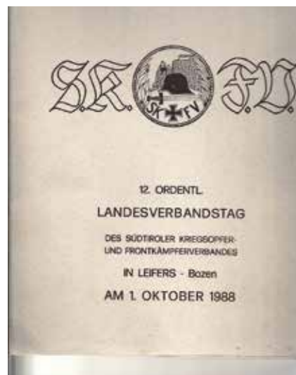
Das Symbol des Südtiroler Kriegsoffer und Frontkämpferverbandes S.K.F.V.

liebte die Natur und ganz besonders die Waldarbeit.