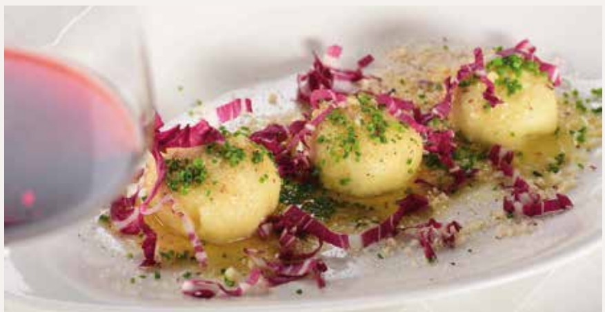
Eine Woche lang steht die Kartoffel in der Pizzeria Christl und in anderen Gasthäusern im Mittelpunkt.

Weitere Infos zu den „Puschtra Erdepflwochn“ unter www.erdepflwochn.it .