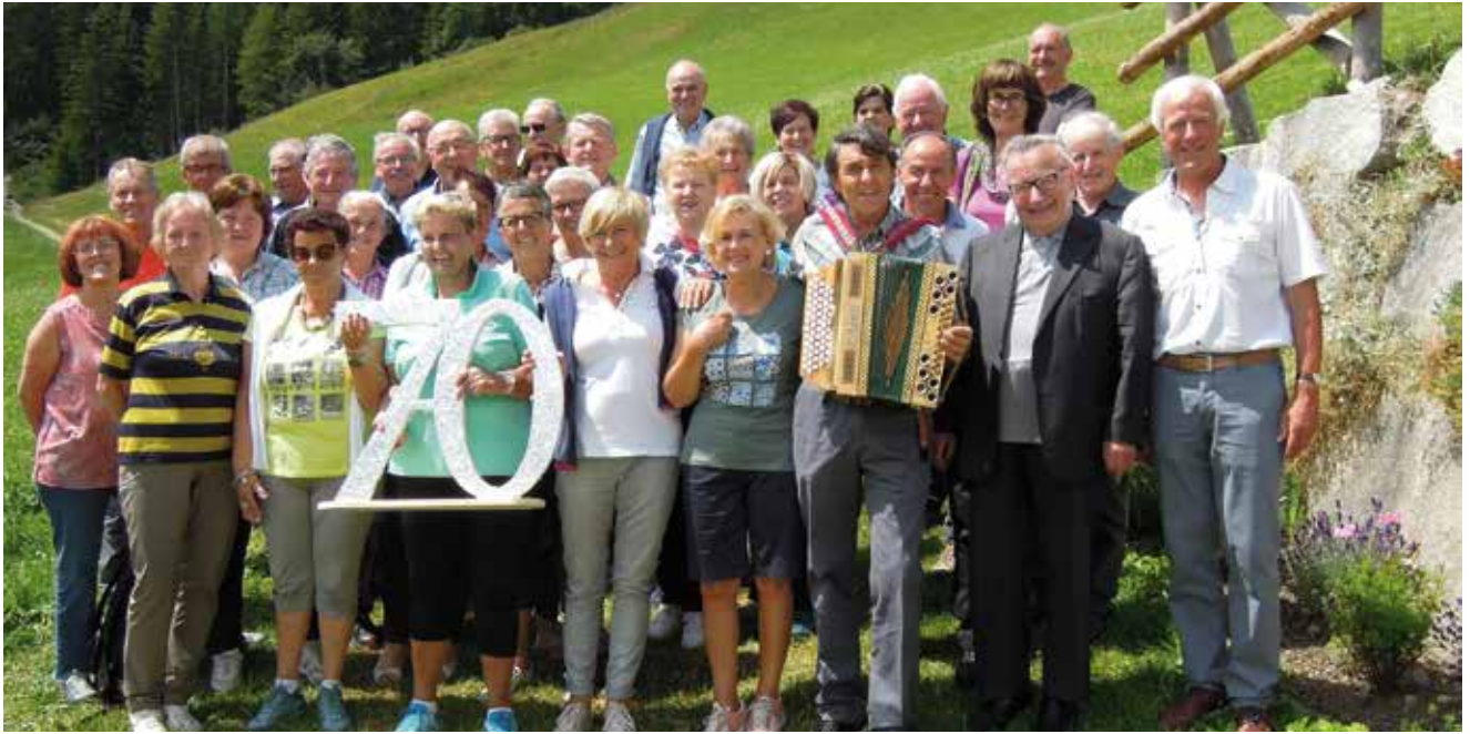
Die 70-Jährigen feierten auf der Oberegger-Alm.