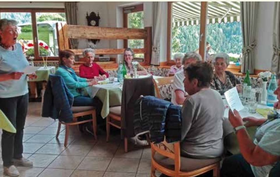
Im Hotel Hubertusstube kehrten die Teilnehmer zu einer Marende ein.

Anfang Juni flatterte allen Seniorentreffteilnehmern eine gefällige Einladung zum traditionellen Abschlussausflug zu. Diesmal war Niederolang an der Reihe, die Organisation zu übernehmen. Es ging trotz Schlechtwetterankündigung mit viel Sonne im Herzen nach Brixen, wo wir in Milland einen Besuch bei der dem China-missionar geweihten Freinademetzkirche machten. Diese Kirche ist ein architektonisches Meisterwerk des Brunecker Architekten Othmar Treffer und wurde 1985 vom Bischof Gargitter eingeweiht. Wir bestaunten die Größe (Platz für ca 2000 Personen), das „Denkmal der Leidenden“ beim Aufstieg zu ihr, die zwölf Nischen mit den Apostelstatuen, das Taufbecken, die 14 Stationen des Kreuzweges, die Ciresa Orgel und den spätbarocken Altar aus der alten Kirche Maria am Sand. Eine große Holzskulptur zeigt den Heiligen,