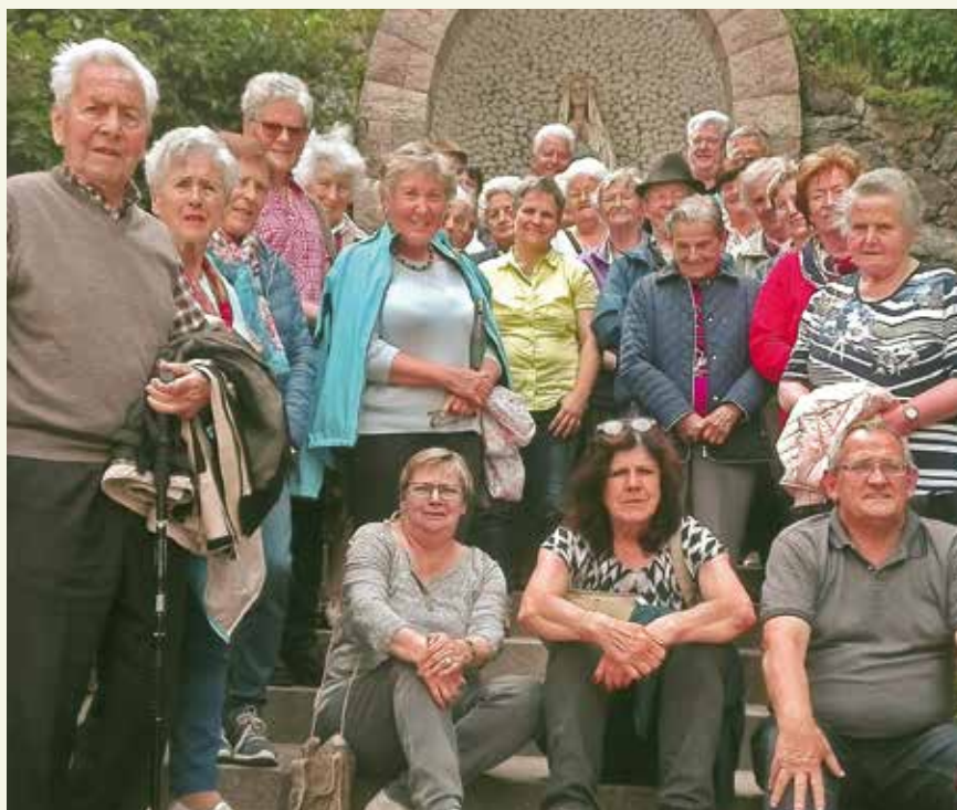
Am Dom auf dem Berg posierten die Senioren für ein Gruppenfoto.

von Kindern umgeben, und nach einer kurzen Andacht konnte jeder noch seine Anliegen im stillen Gebet vorbringen. Nun ging's nach Lajen, unserem Ausflugsziel. Nach dem Besuch der übergroßen Pfarrkirche zu den hl. Stephanus und Laurentius, deshalb auch „Dom auf dem Berg“ genannt, ging's zum gemütlichen Teil. Ein Gruppenfoto wurde geknipst, dann kehrten wir im Hotel Hubertusstube ein und genossen eine schmackhafte Marende. Mariedl und ihr Team hatten einen netten Glückstopf vorbereitet, und die Gewinner freuten sich über die Naturprodukte. Schnell verrann die Zeit und wir kehrten wohlgelaunt und dankbar mit trockenen Regenschirmen nach Hause zurück.