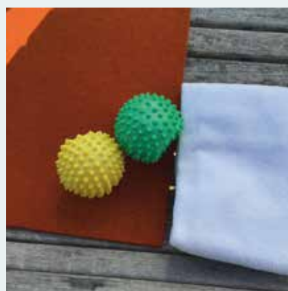
Auch sportliche Aktivitäten kommen im Pflegeheim nicht zu kurz.