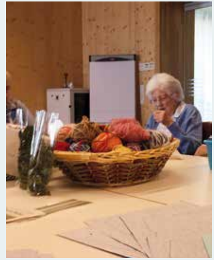
Im Bastelraum gehen einige Frauen ihrer Leidenschaft zum Nähen und Stricken nach.

Beruf. Den Bedürfnissen der einzelnen Bewohner gerecht zu werden und ständig unter einem gewissen Zeitdruck zu stehen, sind bestimmende Faktoren im Arbeitsalltag des Pflegepersonals. Die Gefahr der Erschöpfung und des Ausgebranntseins ist immer präsent. Viele, meist Frauen, arbeiten daher auch in Teilzeit um mit ihren körperlichen und psychischen Ressourcen haushalten zu können. Noch arbeitet in unseren Heimen vorwiegend einheimisches Personal. Der errechnete Bedarf an Arbeitskräften für die nächsten zehn Jahre zeigt aber deutlich, dass man bereits jetzt die notwendigen Maßnahmen einleiten und die Rahmenbedingungen schaffen muss, um auch in Zukunft Fachpersonal gewinnen zu können. In-