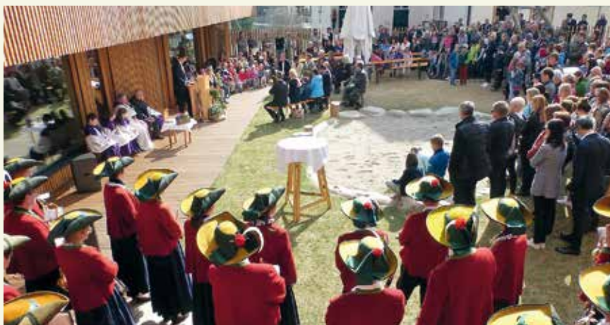
Zahlreiche Olanginnen und Olang waren der Einladung zur Eröffnung des Kindergartens in Niederolang gefolgt.

Dieser Tag wird den NiederolangerInnen noch lange in Erinnerung bleiben!