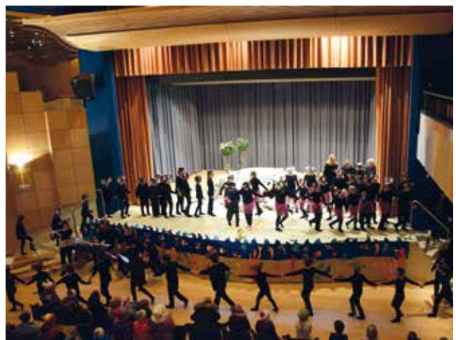
Unter lang anhaltendem Applaus verabschiedeten sich die Darsteller/innen vom zahlreich erschienen Publikum.