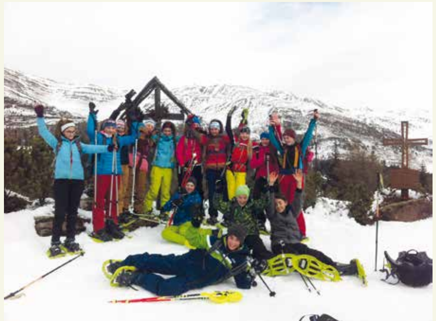
Geschafft! Die Schüler der 2. Klassen der Mittelschule Olang auf dem Seikofel.

Nun warteten die Lawinenübungen auf uns: als erstes lernten wir, wie man mithilfe eines Lawinensuchgeräts einen Verschütteten lokalisiert, als nächstes durften wir mit Sonden verschiedene Gegenstände unter dem Schnee ertasten. Zuletzt verfolgten wir noch auf der Karte den Weg von Olang auf den Seikofel.