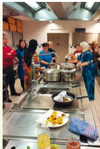
Die Redensart „viele Köche verderben den Brei“ wurde beim Kochkurs im Kongresshaus von Mitterolang eindrucksvoll widerlegt.