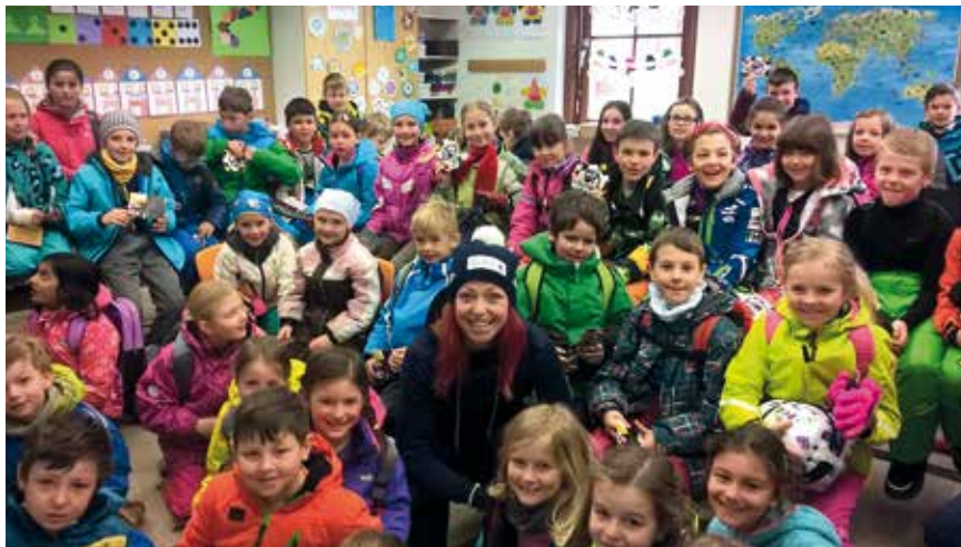
Die Skiweltcup-Athletin Hanna Schnarf besuchte im Rahmen der Skiwoche die Schülerinnen und Schüler in Oberolang.

Kaum erwarten konnten es die Kinder, mit ihrem Ski- oder Snowboardlehrer unterwegs zu sein. Zusätzlich zum Erlernen einer neuen Sportart bzw. zur Verbesserung der Fahrtechnik fand täglich auch