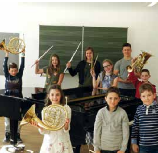
Die Teilnehmer der Musikschule Olang am Musikwettbewerb Prima la Musica.

Herzliche Gratulation an alle Preisträger und ihre Lehrpersonen!