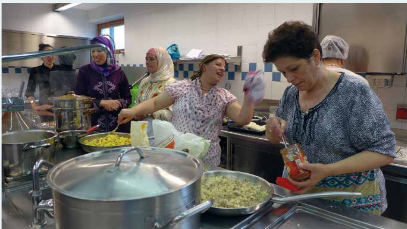
Beim interkulturellen Kochabend stehen Olinger Frauen mit Migrationshintergrund gemeinsam mit einheimischen Frauen am Herd, bereiten kulinarische Besonderheiten aus ihrer Heimat zu und laden zum Verkosten ein.

letzt die Mit-Finanzierung von Veranstaltungen und Bildungstätigkeiten.