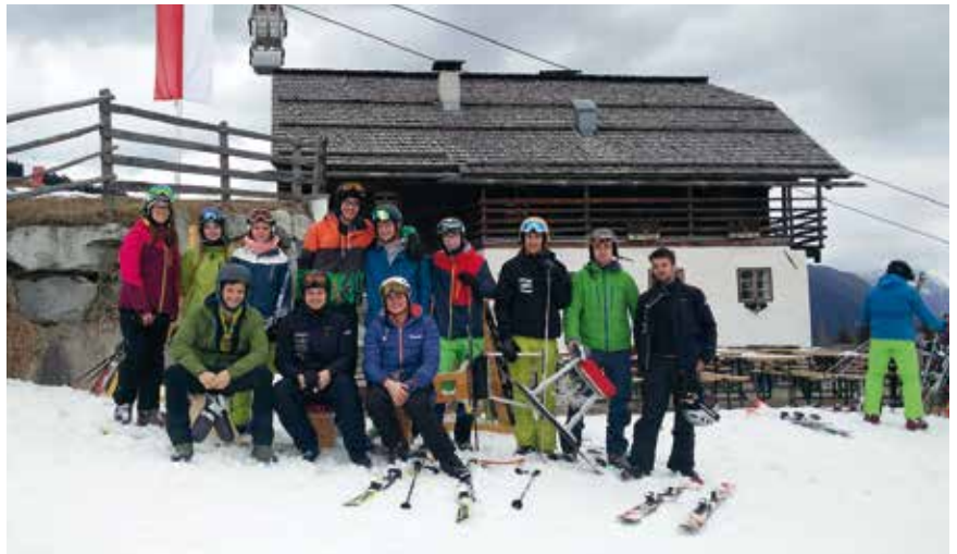
Gruppenbild beim „Olang Beckl Tog“, organisiert von den Geiselsberger Jugendlichen.