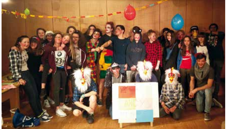
Das närrische Treiben der Faschingszeit macht auch vor den Jugendlichen nicht halt.

Auch für den Sommerbeginn hat sich die Jugendgruppe einiges ausgedacht. Der Jugendgruppe ist es dabei wichtig, gemeinsam mit der Dorfgemeinschaft über ein Thema zu diskutieren, welches weit