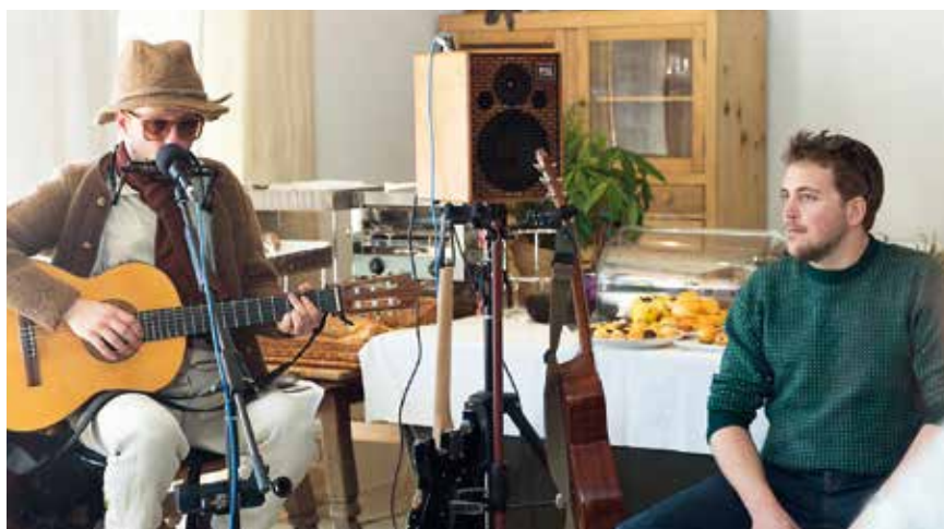
Für die musikalische Umrahmung der gelungenen Veranstaltung sorgte die Gruppe „Dachale fan Toule“.