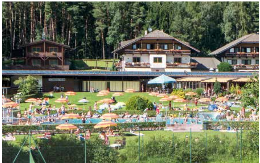
Der Pachtzins für das Schwimmbad wurde für die Saison 2017 auf 5.000 Euro inkl. MwSt. reduziert, da aufgrund der Bauarbeiten für das Sportgebäude nicht die gesamte Fläche genutzt werden kann.

Der Jugenddienst Bruneck organisiert für Grundschüler auch heuer wieder den „Erlebnissommer Olang 2017“. Die Gemeindeverwaltung unterstützt auch dieses Projekt, indem kostenlos Räumlichkeiten genutzt werden können und die Verpflegung der Kinder übernommen wird.