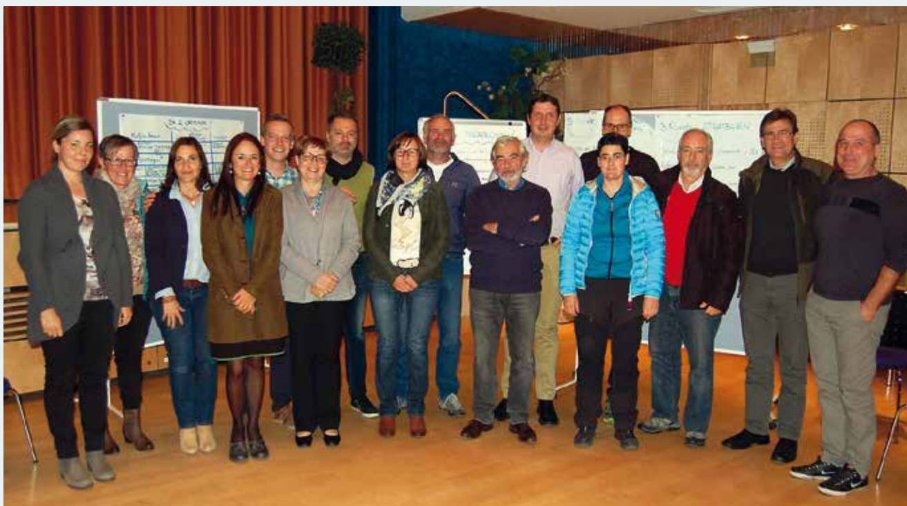
Im Rahmen des Themenschwerpunkts 100 Jahre 1. Weltkrieg wurden einige Veranstaltungen organisiert.

stützt auf Bezirksebene der Bildungsweg Pustertal die Arbeit der Bildungsausschüsse und gibt zusätzliche Anreize und Ide-