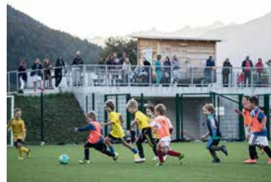
Die Planungen für die Fußballsaison 2017-2018 haben begonnen. Interessierte können sich ab sofort bei der Sektion Fußball einschreiben.