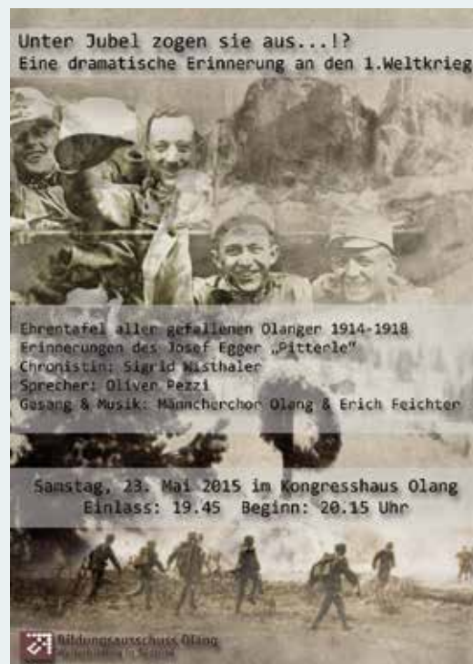
Im Rahmen des Themenschwerpunkts 100 Jahre 1. Weltkrieg wurden einige Veranstaltungen organisiert.

Wir haben uns damals regelmäßig zu Vorstandssitzungen getroffen, wo die verschiedenen Maßnahmen besprochen und beschlossen wurden. Außerhalb davon haben wir uns dann noch oft in kleinerem Kreis abgesprochen, um einfach effektiver und zielgerichteter arbeiten zu können. Der Vorstand des Bildungsausschusses ist aber keineswegs auf sich alleine angewiesen. Es geht um konstruktive Zusammenarbeit und neben dem Amt für Weiterbildung des Landes Südtirol unter-