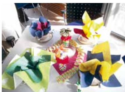
Die Tische im Kongresshaus waren passend zur fünften Jahreszeit gedeckt.