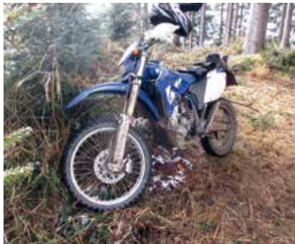
Im letzten Jahr wurden im Forstinspektorat Welsberg mehrere Motorräder beschlagnahmt.

Dieses Landesgesetz regelt den Verkehr mit motorbetriebenen Fahrzeugen (Auto, Motorrad, Quad, Motorschlitten) auf Forst-