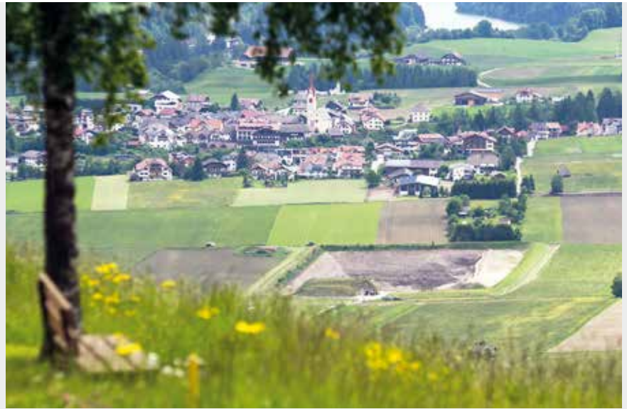
Obwohl die Schottergrube Sanner (im Bild) noch in Betrieb ist, hat die Dienststellenkonferenz der Provinz im Jänner grünes Licht für die Eröffnung einer neuen Schottergrube – außerhalb der Bannzone - im Ausmaß von 100.000 Kubikmeter gegeben.