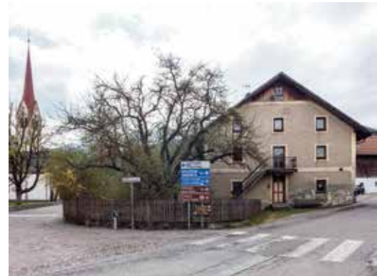
Der Gemeinderat lehnte eine Änderung der Bannzone für die Verlegung des Sattlerhofes (im Bild) mit Hinweis auf das negative Gutachten der Landeskommision für Natur, Landschaft und Raumentwicklung ab.

Sollte keine Mehrheit für den Antrag um Änderung der Bannzone zustande kommen, solle man den Bauer trotzdem unterstützen, um gemeinsam eine Lösung zu finden, hofften Markus Agstner und Fabi-