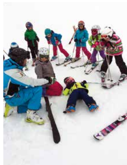
Richtiges Verhalten im Ernstfall lernten die Kinder beim Erste-Hilfe-Kurs.