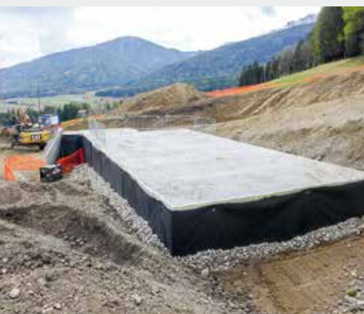
Die Bauarbeiten für die Errichtung des Wasserspeichers Urtal sind mittlerweile weit fortgeschritten.

Georg Steurer wies darauf hin, dass eine weitere Schottergrube in Olang im Ausmaß von 100.000 Kubikmeter genehmigt