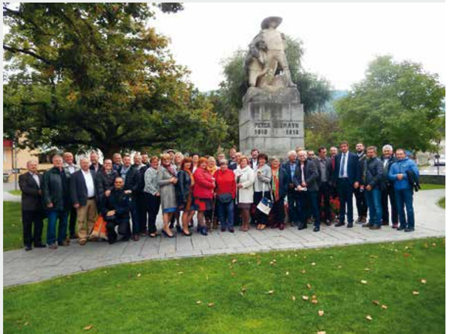
Eine Gruppe von rund 50 Bürgermeister/innen aus der Slowakei, weilte vor kurzem auf Lehrfahrt in Olang.

Ziel der Exkursion war es, durch Besichtigungen und Fachvorträge, Einblicke in neue Entwicklungen und Fördersysteme zu gewinnen und diese dann nach Möglichkeit, in der slowakischen Region der Tatra nacheinander umzusetzen.