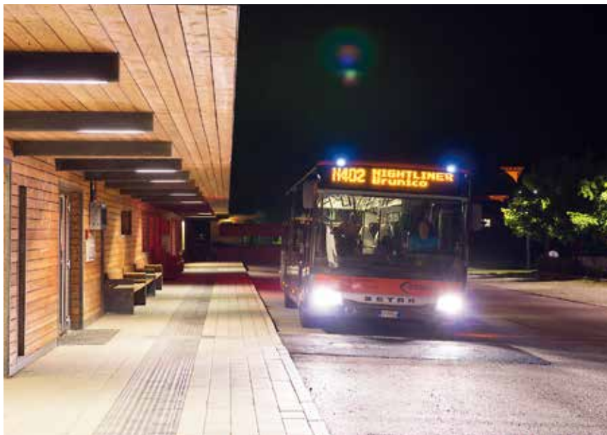
Der Anteil der Gemeinde Olang an den Kosten, für den von Jugendlichen viel genutzten Nightlinerdienst, beläuft sich auch 3.608,20 Euro.

In der Schwefelquelle wird nur ein zusammenfassender Überblick über die Beschlüsse des Gemeindefausschusses gezeigt. Alle öffentlichen Verwaltungen sind jedoch verpflichtet, Akten und Verwaltungsmaßnahmen auf den Internetseiten zu veröffentlichen. Sie können daher in alle Beschlüsse, Baukonzessionen, Eheaufgebote und andere Dokumente, für die Dauer der Veröffentlichung, auf den Internetseiten der Gemeinde www.gemeinde.olang.bz.it unter der Rubrik „Amtstafel“ Einsicht nehmen.