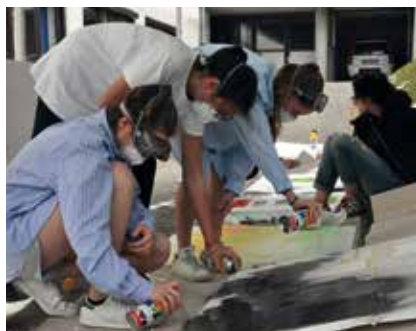
Sich ganz legal mit der Spraydose kreativ ausleben: das konnten die Teilnehmer beim Graffiti Workshop im Jugendtreff.