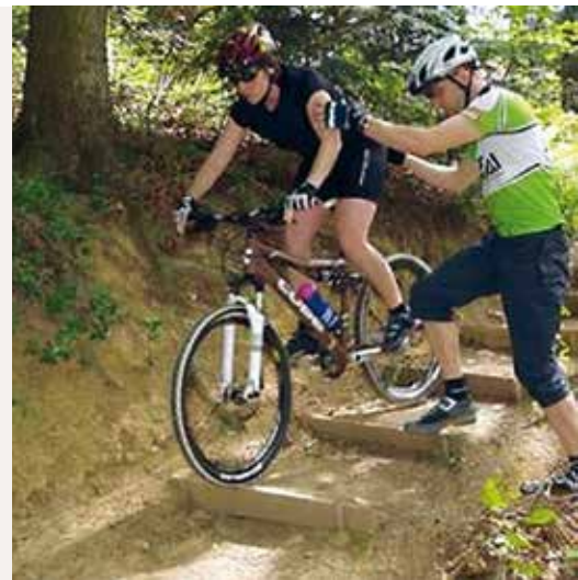
Ein Mountainbikettraining speziell für Damen organisiert der ASC Olang in Zusammenarbeit mit dem Tourenanbieter Dolobike.

Wir machen fünf Einheiten zu je zwei Stunden 1. Treffen am Samstag 06. Mai