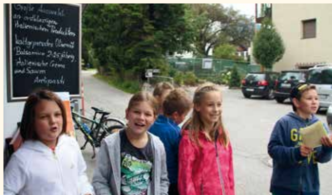
Dann wurden eifrig Lebensmittel für bedürftige Menschen gesammelt.