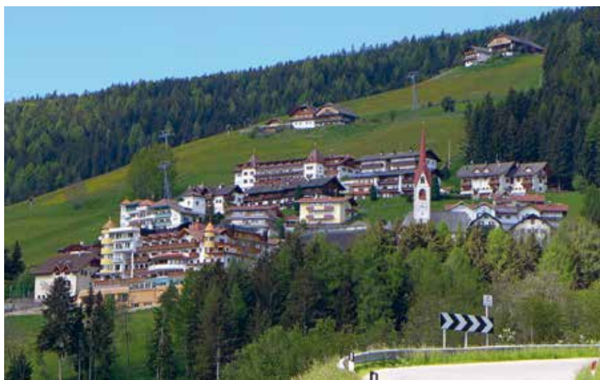
Das Landesgesetz sieht bereits eine Reduzierung des Steuersatzes für gewerbliche Immobilien auf 0,56 % vor. Der Gemeinderat geht nochmal einen Schritt weiter und verringert den Hebesatz auf 0,53 %.