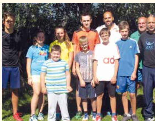
Gruppenbild bei den Finalspielen der Sommerkurse.

Wir bedanken uns beim Pustertaler Tennisservice, der die verschiedenen Kinderkurse übernommen hat und bei allen, die uns immer wieder unterstützen.