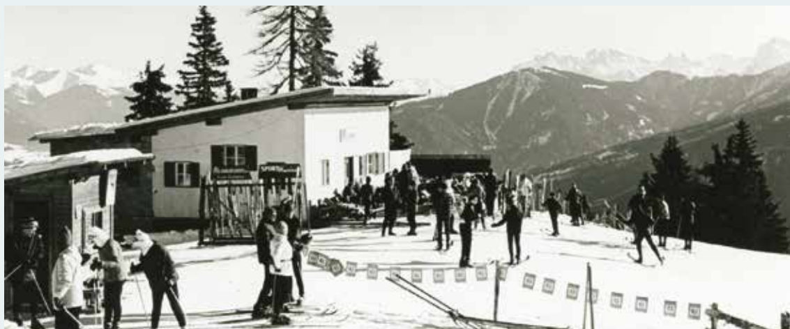
Bei der Prackenhütte und am Alpenlift herrschte stets reges Treiben.