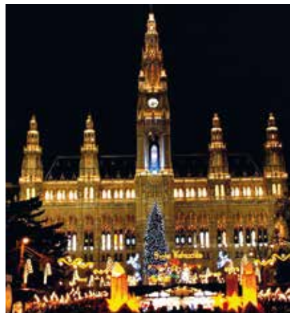
Der Baum aus Olang wird - so wie im Bild aus dem letzten Jahr - im ganzen Advent den Wiener Rathausplatz verschönern.

Den schönsten und geeignetsten Baum in Südtirol haben bereits im letzten Sommer die eigens angereisten zuständigen Wiener Magistratsbeamten in Olang aufgefunden gemacht. Das gereicht unserem Ort zu einer nicht unbedeutenden Ehre, da sich viele andere jedes Mal darum reißen würden.