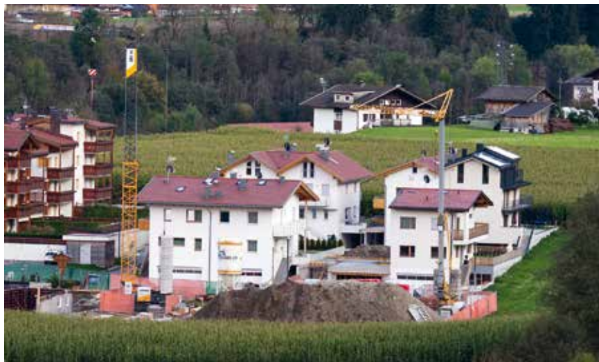
Mit dem festgesetzten Freibetrag von 550 Euro sind 70% der Eigentümer von Hauptwohnungen gänzlich von der Steuer befreit.

Ein Kapitel für sich sind die Steuerfreibeträge, die grundsätzlich bereits vom Gesetz festgelegt sind. Sie werden nach dem Katastertarif berechnet und sind daher von Gemeinde zu Gemeinde verschieden, weshalb man sie nicht so einfach mit jenen von anderen Orten vergleichen könne, vertiefte Bachmann. Er zeigte sich aber überzeugt, dass man mit der vorgeschlagenen Erhöhung des Freibetrages von 433,04 Euro auf 550 Euro den Bürgern sehr entgegengekommen sei. Die Eigentümer der verbleibenden 30% der Hauptwohnungen, welche nicht vollstän-