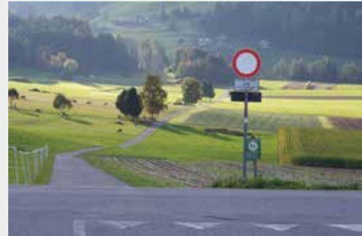
Das Zusatzschild, welches die Entfernung bis zum effektiven Beginn des Durchfahrtsverbotes anzeigt, ist mittlerweile weggedreht worden. Ob das nicht berechnete Autofahrer daran hindert die Straße zu befahren, wird sich zeigen.

hinweist. Er vertrat die Meinung, dass Autofahrer dadurch ermutigt werden, trotzdem die Straße zu befahren.