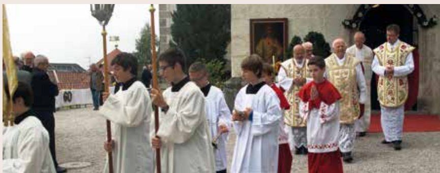
Der Jubilar mit seinen Mitbrüdern beim Auszug aus der Kirche.