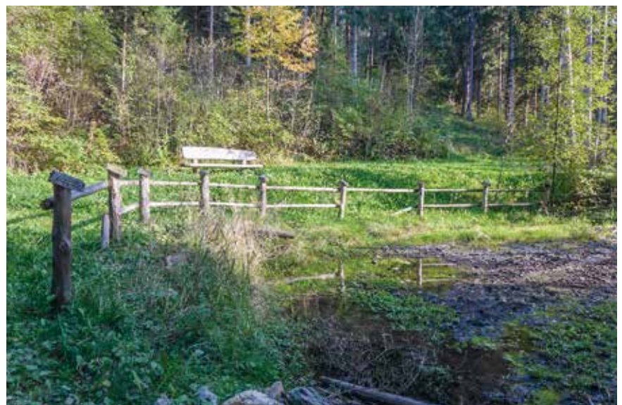
Nach über zweijähriger Planung soll Mitte Oktober definitiv mit den Arbeiten zur Gestaltung der Naherholungszone am Brunstbach begonnen werden.

Mit der Durchführung der Arbeiten wird Mitte Oktober begonnen.