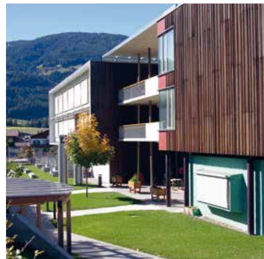
Unter bestimmten Voraussetzungen leistet die Gemeinde einen Beitrag für den Unterhalt und die Betreuung mittelloser Bewohner des Pflegeheims, welcher separat in der Bilanz ausgewiesen wird.

Martin Vieider äußerte Kritik am Vorgehen der Gemeinde, die Umweltgelder des Landes, wenn auch nur zeitweise, in den Ausbau des Kindergartens zu stecken. Besser wäre es ein eigenes Kapitel zu bilden, aus welchem dann die entsprechen-