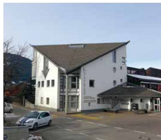
Ab Dezember befindet sich die Praxis für Kinder- und Jugendheilkunde im Sprengelgebäude im Kanonikus Gamper Weg.

Die neue Praxis, die sich im Sprengelstützpunkt der Gemeinde Olang befindet (Kanonikus Gamper Weg 5), nimmt ihren Betrieb mit dem 01.12.2014 auf. In der Zwischenzeit wird die kinderärztliche Betreuung voraussichtlich durch die Hausärzte von Olang und Rasen-Antholz gewährleistet.