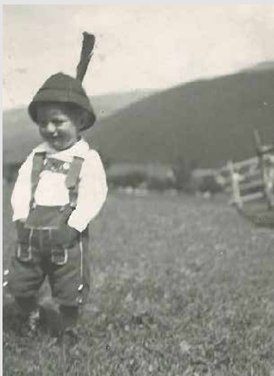
Der junge Hoferbe.

Mein Großvater verstarb am 8. November 1947 in der Früh an Herzversagen. Eine Stunde später wäre der Notar angesagt gewesen, um die bereits mündlich ver-