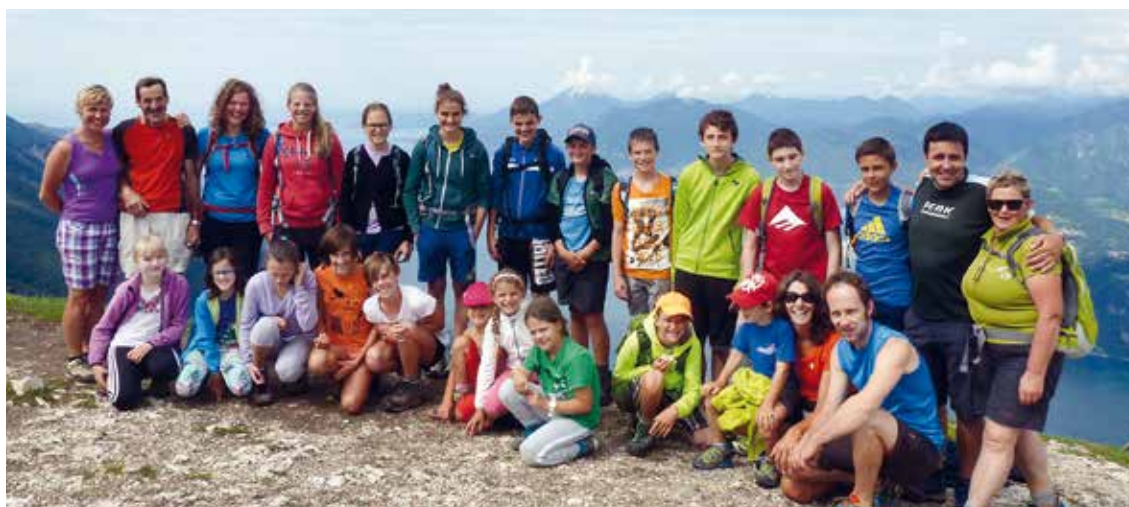
Gruppenfoto auf dem Monte Baldo

Nacht auf engstem Raum stand uns bevor. Da es am nächsten Morgen immer noch regnete, beschlossen wir, einen Tag früher als geplant nach Hause zu fahren.