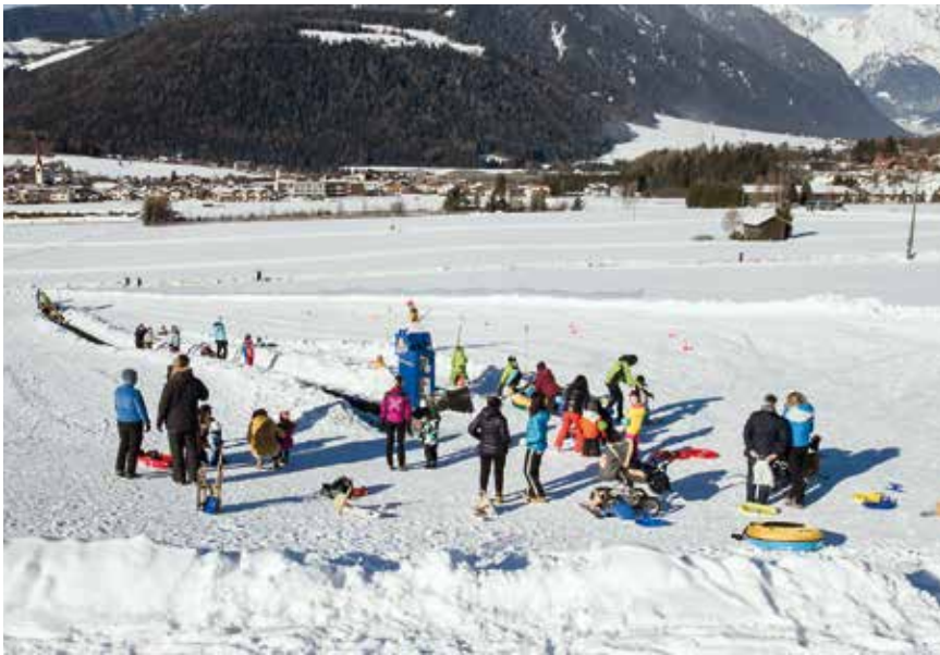
Immer mehr Einheimischen aber auch zahlreiche Touristen nutzten im vergangenen Jahr das Angebot beim Zauberteppich in der Wintersportzone Panorama.