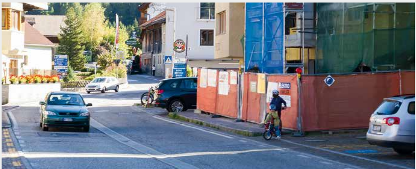
Mittlerweile ist der Bauzaun versetzt worden, so dass die Fußgänger nicht mehr gezwungen sind auf die Straße auszuweichen.

henden Grundkauf hingewiesen wurde, worauf man in einem Schreiben an das Land ein prinzipielles Interesse am Grundstück vorgebracht habe. Bürgermeister Bachmann ergänzte, dass man auf offiziellem Wege zwar noch keine Mitteilung erhalten habe, zeigte sich aber zuversichtlich, dass man mit dem Land einig werde, falls die Gemeinde das Grundstück künftig nutzen möchte.