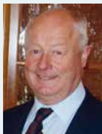
Edmund Töchterle Präsident von 2009 bis 2011