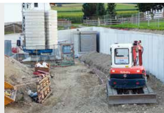
Bei der Feuerwehrhalle in Mitterolang wird eifrig gearbeitet. Sobald die Elektrokabine fertiggestellt ist, werden Techniker der SELNET mit der Verlegung der Anlage beginnen.

jahr mit den weiteren Baumaßnahmen fortfahren kann.