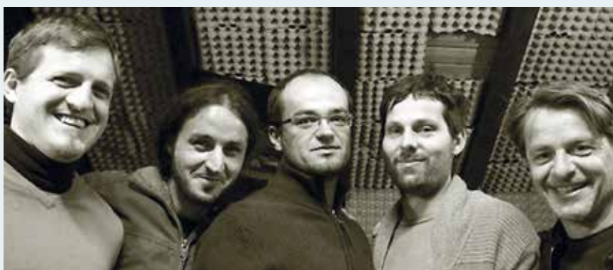
Self Fulfilling Prophecy