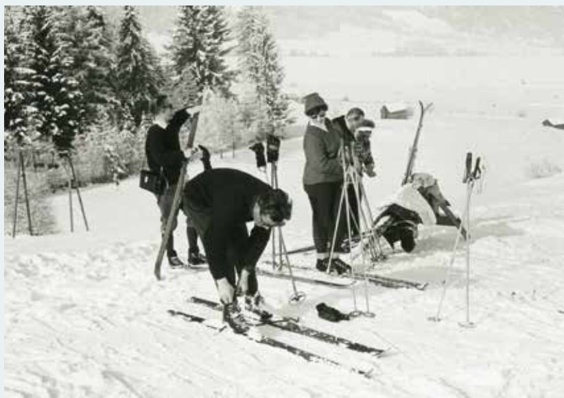
Skilehrer mit Touristen in den 60er Jahren beim Skilift „Keil“ in Oberolang.