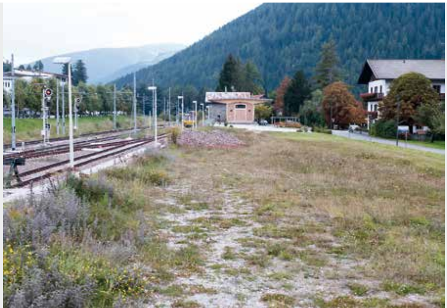
Die Fläche zwischen Parkplatz Boulderhalle und neuem Bahnhof ist von der Eisenbahngesellschaft ans Land übertragen worden. Eine künftige Nutzung der Fläche durch die Gemeinde wäre denkbar.