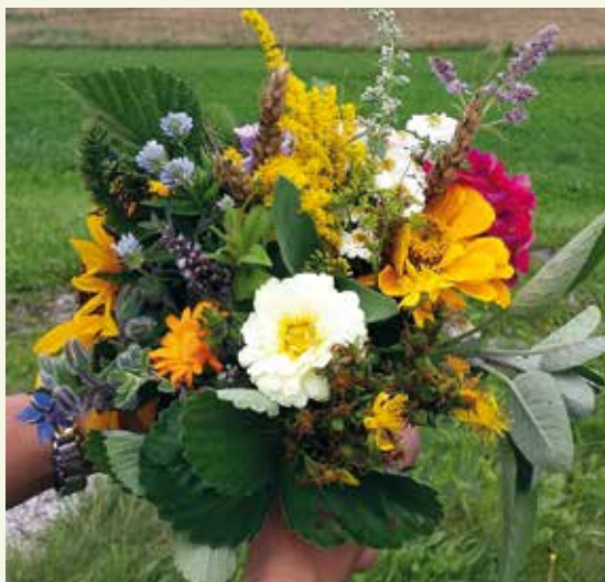
Mindestens sieben verschiedene Kräuter werden zu einem Kräuterstrauß gebunden und in der Kirche beim Festgottesdienst vom Priester gesegnet.

Wir möchten uns an dieser Stelle für die vielen freiwilligen Spenden anlässlich dieser Aktion bedanken.