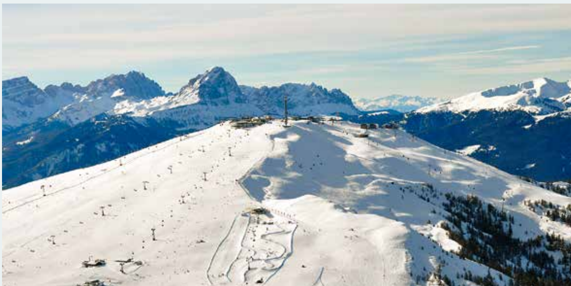
Blick auf die Olangener Seite und den Gipfel des Kronplatz.