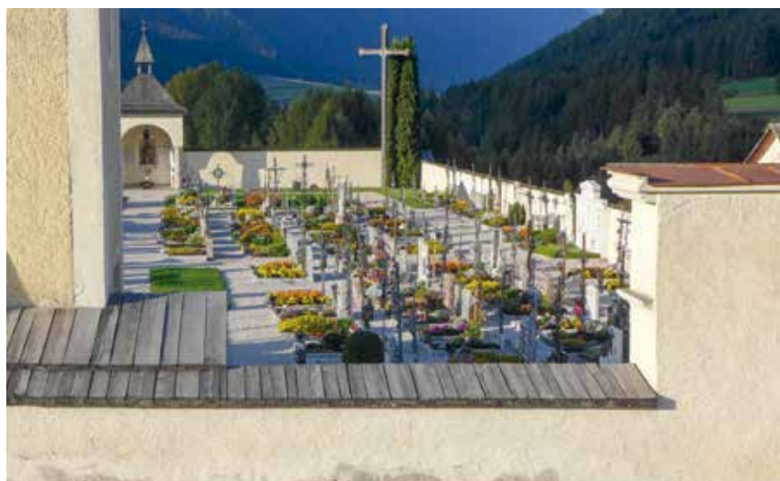
Mit dem für die Bestandsaufnahme der Friedhöfe ausgewiesenen Betrag, wird nicht nur die Ummauerung der Friedhöfe vermessen, sondern auch sämtliche Gräber genauestens erhoben.