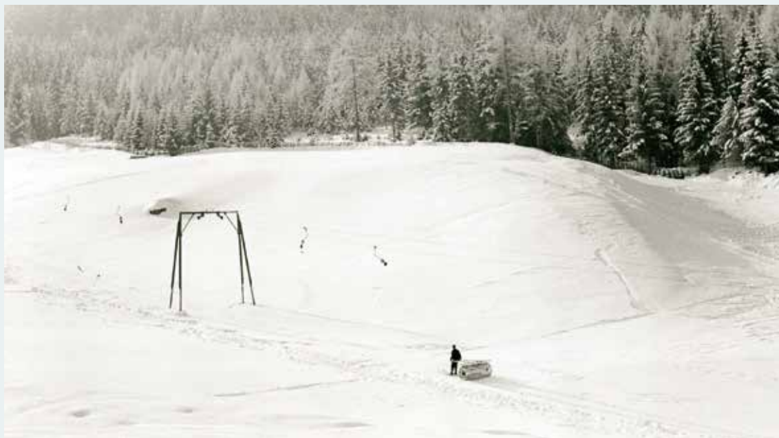
Die Pisten wurden damals noch mit sandgefüllten Rollen, per Hand gewalzt.