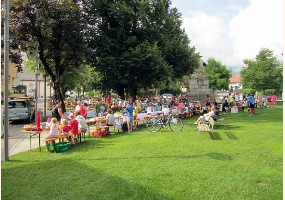
Verkaufen, kaufen oder einfach nur stöbern – der Kinderflohmarkt.

Petra Graber Tschurtschenthaler, KFS Pfarre Olang