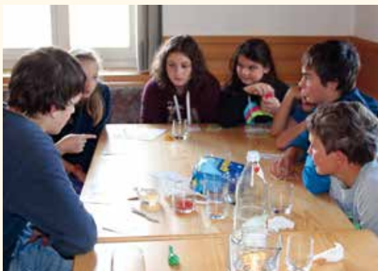
Mit lustigen Spielen ließ man den Aktionstag ausklingen.

die Minis bei der Aktion LeO (Lebensmittel und Orientierung) beteiligt, da auch die Bevölkerung spendenfreudig war. Abschließend wurden sie mit Hot-Dogs und Faschingskrapfen belohnt. Nach einigen weiteren lustigen Spielrunden endete dieser gelungene Aktionstag.