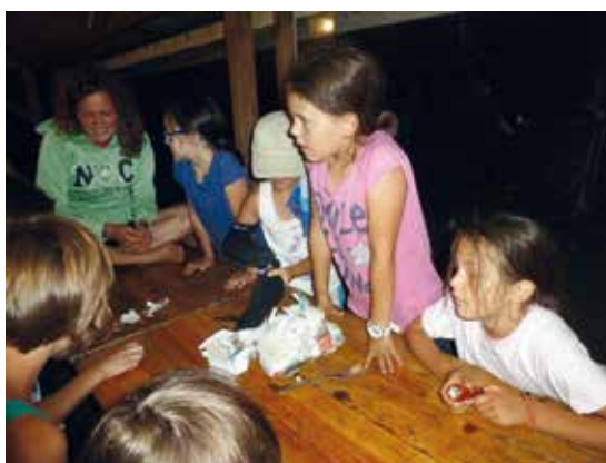
Abends dauerte es lang, bis in der Hütte in Laghel Ruhe einkehrte.

Somit endete unser Hüttenlager 2014 mit vielen schönen Eindrücken und Erlebnissen mit der Fahrt durch das Sarcatal nach Hause. Die Gruppe hatte trotz Altersunterschied Ausdauer und Zusammenhalt gezeigt und trotz Fehlens von einer Stammperson sehr viel Spaß. Es wäre jedoch erwünscht, dass diese Lücke wieder geschlossen wird. Auch wenn es heuer etwas anders war als in den vergangenen Jahren, ist vor allem der Mix aus Klettern und Schwimmen eine bleibende Erinnerung.