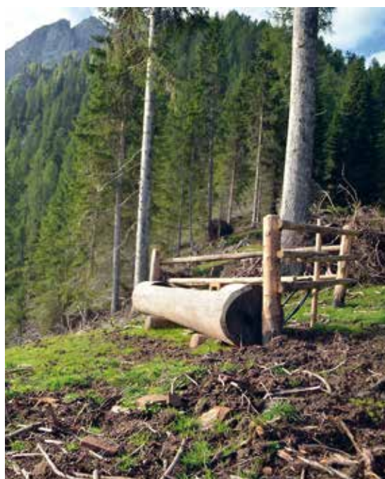
Ohne die Errichtung von Wasserstellen ist keine Weideverbesserung möglich, weil sich das Vieh sonst immer an den selben Stellen konzentriert.

Am Ende der informativen und aufschlussreichen Begehung, waren sich alle Beteiligten einig, dass solche Treffen sehr fruchtbar sind und das allgemeine und gegenseitige Verständnis aufgebessert wurde.