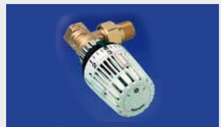
Thermostatventile regeln abhängig von der Umgebungstemperatur über ein Ventil einen niedrigeren oder höheren Durchfluss.

bei Heizungen mit hoher Vorlauftemperatur Lamellen und Stege eine dicke Staubschicht aufweisen. Um ein Absinken der Wärmeleistung aber auch gesundheitliche Belastungen zu verhindern, sollten die Heizkörper von Zeit zu Zeit gereinigt werden.